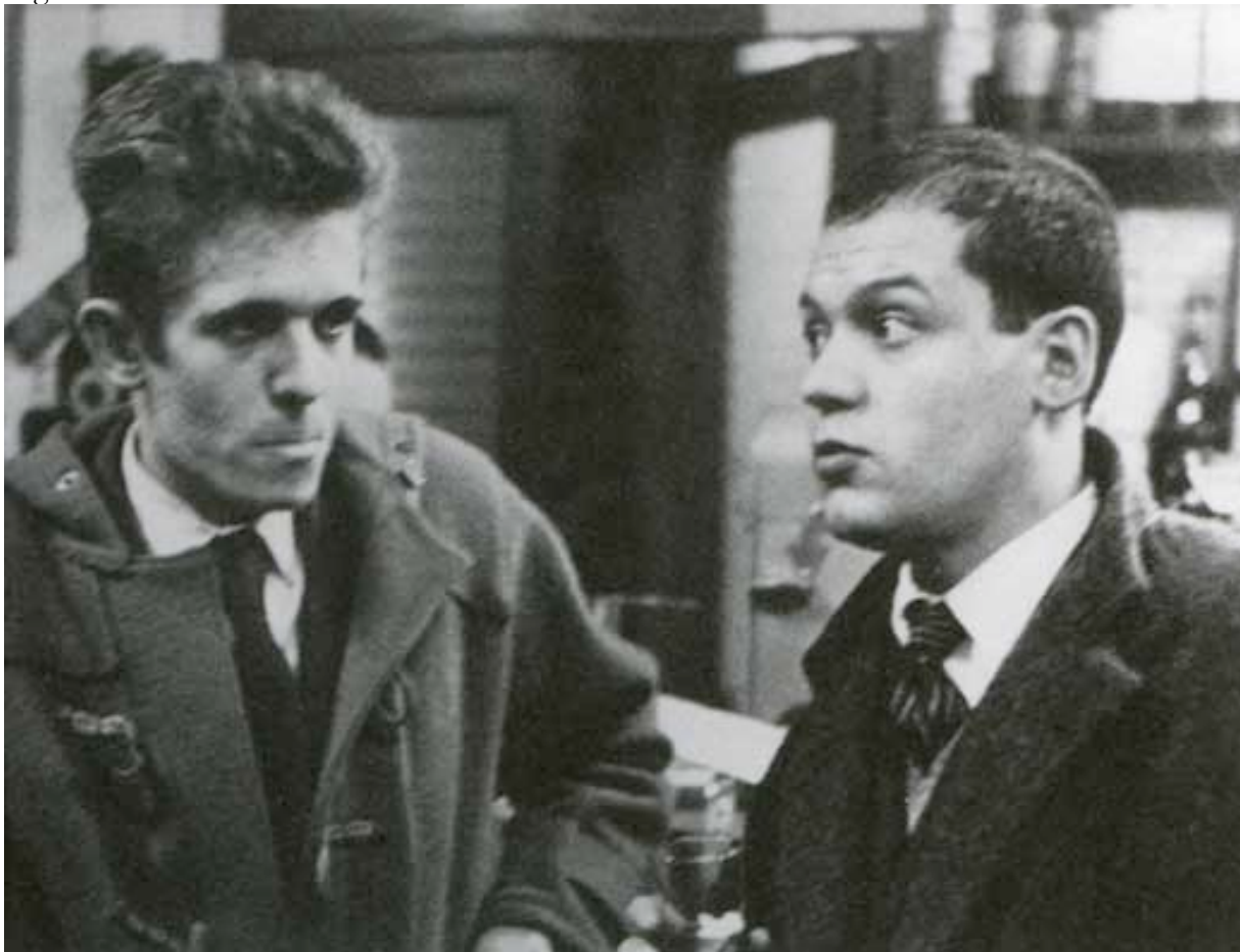
Con Piero Manzoni al Bar Giamaica, Via Brera 22, Milano

1957 - Prima mostra personale alla Galleria Totti di Milano con uno scritto di Roberto Sanesi. Riceve il premio Mochetti " Tavolozza D'Argento " al Circolo della Stampa di Milano. Inizia a lavorare la ceramica che però abbandona quasi subito; la riprenderà solo nel 1990. Con Piero Manzoni firma il manifesto contro il Premio San Fedele in nome dell'Avanguardia, organizzando una contro-mostra al bar Giamaica.